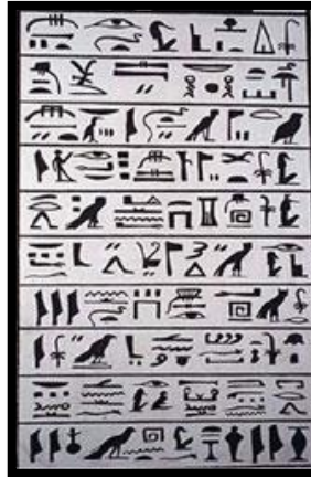
Figura 2: Escrita Ideográfica