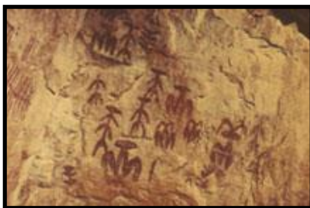
Figura 1: Escrita Pictórica

Conforme Cagliari (2007), a escrita se divide em três etapas, ou seja, um conjunto de fases distintas: são elas, a pictórica 1 , a ideográfica e a alfabética. A figura 01 representa a pictórica e se distingue em desenhos ou pictogramas, ou seja, são os que representam um símbolo e que aparece muito nas histórias em quadrinhos. A fase seguinte é a ideográfica que é definida por desenhos ou figuras representadas em objetos que com o passar dos anos, essas representações começaram a se tornar algumas palavras do alfabeto, e por fim, a última fase que é a alfabética que é caracterizada pelo uso das letras.